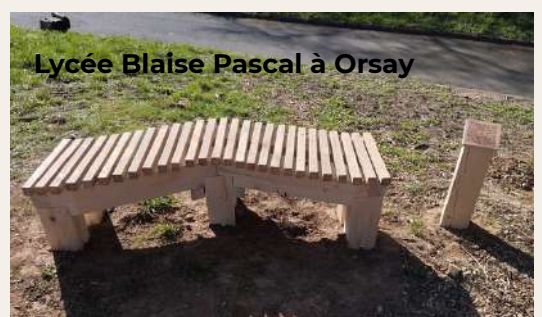
Lycée Blaise Pascal à Orsay