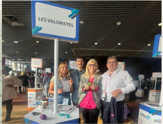
Salon Effervescence 93