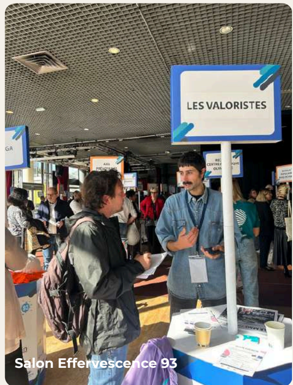
Salon Effervescence 93