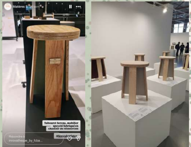
Expo Matières solidaires, FCBA