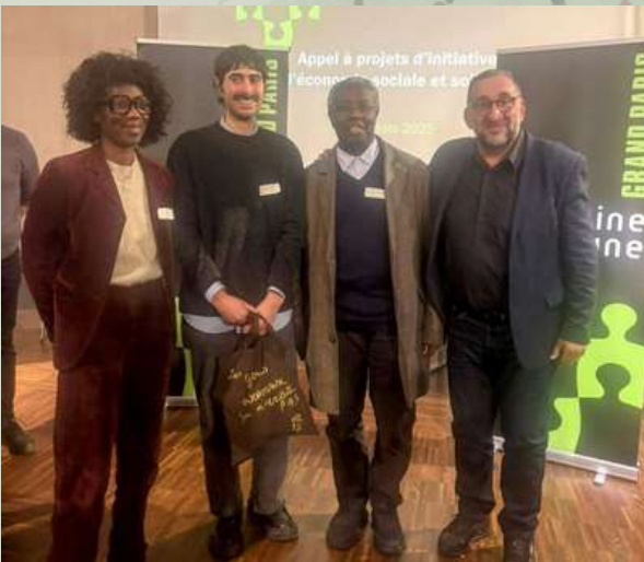
Lauréat Plaine Commune ESS