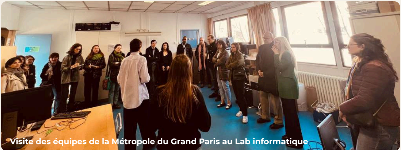
Visite des équipes de la Métropole du Grand Paris au Lab informatique