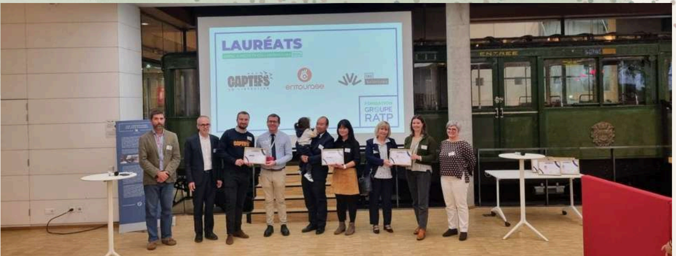
Lauréat Fondation RATP