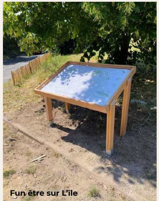
Fun être sur L'île