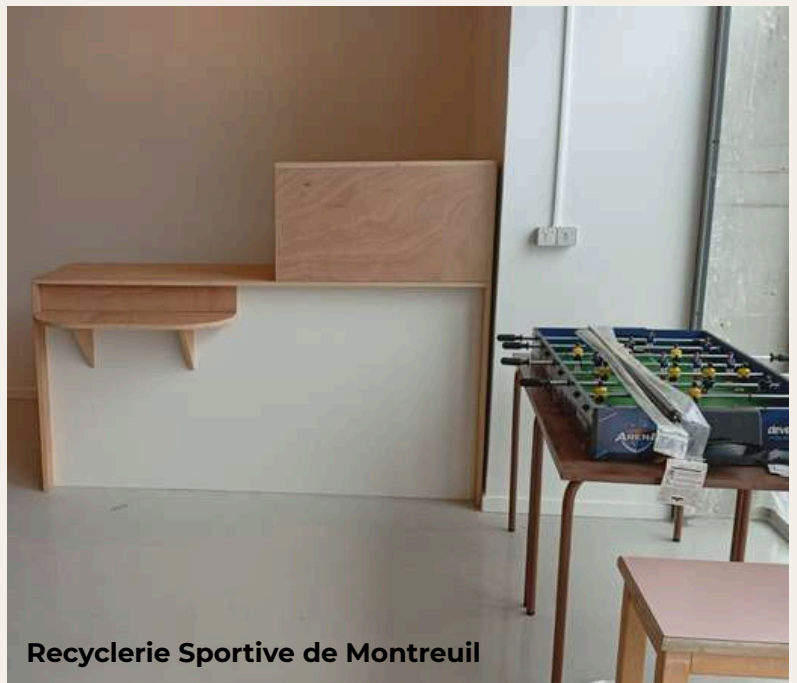
Recyclerie Sportive de Montreuil