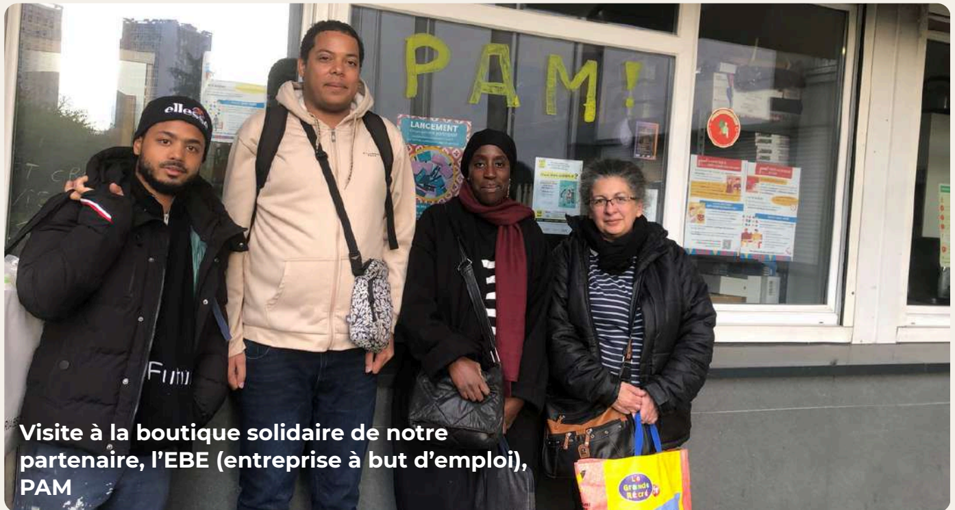
Visite à la boutique solidaire de notre partenaire, l'EBE (entreprise à but d'emploi), PAM