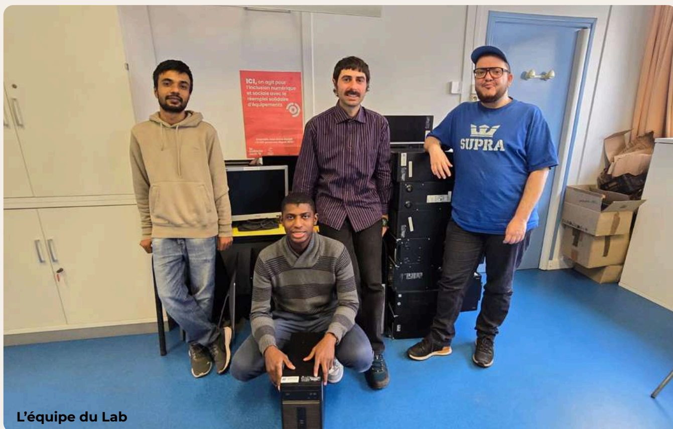
L'équipe du Lab

Quelle année 2025 pour le Lab Informatique ! Démarrage à la Ressourcerie Etés (Saint-Ouen), don important d'équipements informatiques du Crédit Coopératif, lancement d'ateliers de sensibilisation, ventes solidaires, recrutement de deux opérateurs valoristes, arrivée d'un encadrant d'insertion ... Le Lab passe à l'échelle !