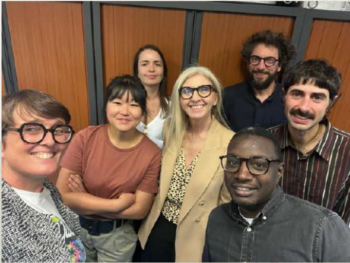
Une nouvelle gouvernance